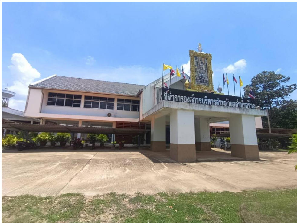
อาคารสำนักงาน